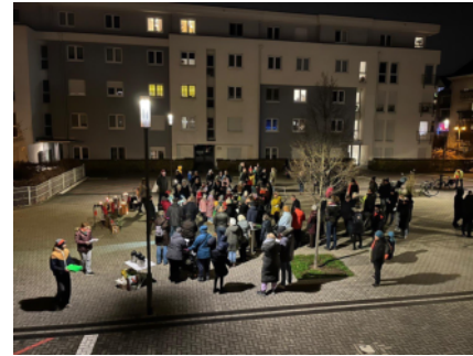
Adventsliedersingen auf der Therese-Herger-Anlage

10 Uhr in der Sport- und Kulturhalle Pfungstadt.