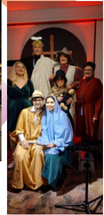
Weihnachten in der Stadtmission